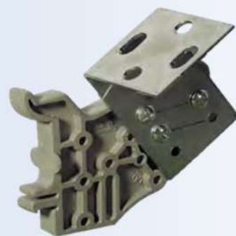
Support HPC2 associé à une patte métallique HSU